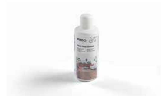
Środek do czyszczenia podłóg winylowych Pergo 1 l PGVCLEANING1000